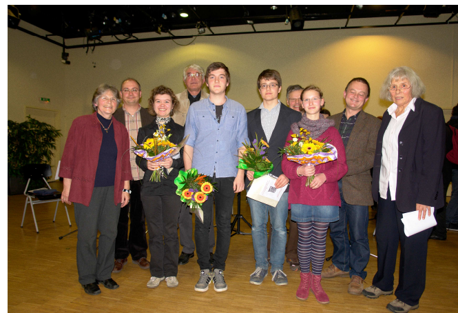
Preisträger und Jury 2012 und Stifterin Förderpreis

Förderpreis Klaus Obermayer: Geldpreis in Höhe von 100,- €