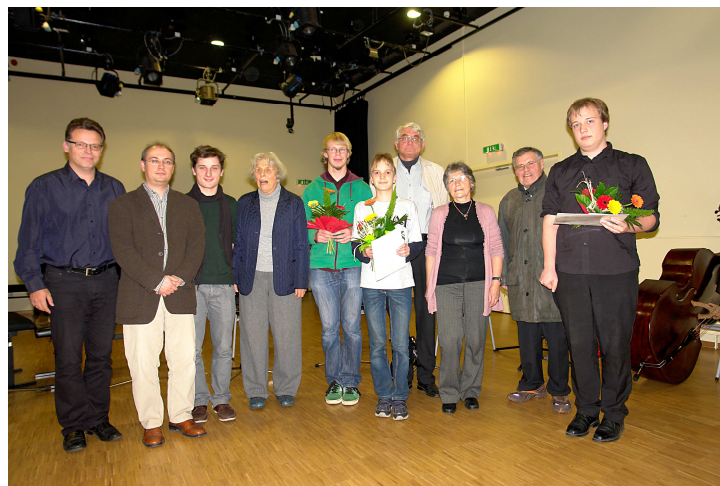
Preisträger und Jury 2011, Leiter der Komponistenklasse und Stifterin Förderpreis